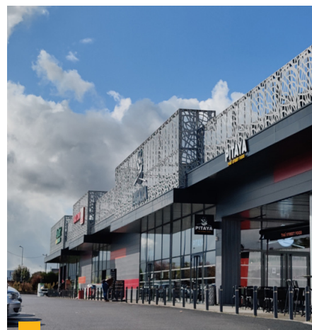
Retail Park à Tours (37)

**** Jusqu'à 2020 : TDVM. À partir de 2021 : Taux de distribution.