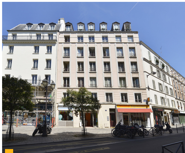
2 rue de Beccaria à Paris (75012)

Deux actifs situés à Nogent-le-Rotrou (28) et à Gruissan (11) ont été cédés en ce début de semestre pour un prix global de 4,65 M€. Votre SCPI a également vendu sa quote-part de 65% dans le centre commercial des Hauts de Clamart (92) au prix de 10,66 M€. Elle a aussi signé des promesses de vente pour 4 actifs situés à Masny-Ecaillon (59), Charenton-le-Pont (94), Fumel (47) et Bressuire (79). Ces arbitrages pourront offrir la possibilité de réinvestir dans des immeubles plus récents et plus performants.